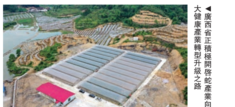
▲廣西省正積極開啓蛇產業向大健康產業轉型升級之路

據稱，廣西林業局協商自治區人工繁育野生動物處置與維穩工作專班成員單位並達成共識，積極推進人工繁育蛇產業向民族醫藥、美容保健、日用化工等大健康產業轉型升級，獲得健康產業、現代農業企業積極響應。廣西有關部門稱，力爭用3到5年的時間，將廣西蛇產業打造成全國以壯瑶民族醫藥應用為特色和核心的大健康產業。