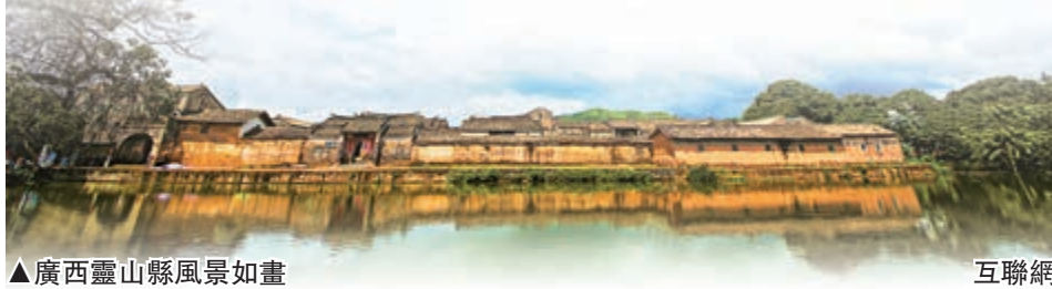
▲廣西靈山縣風景如畫