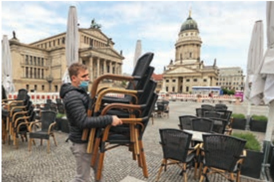
▲德國柏林御林廣場餐廳職員14日準備重新營業