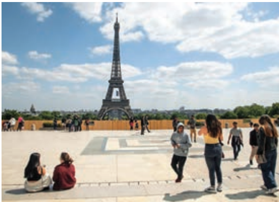
▲法國艾非爾鐵塔前行人稀少

波羅的海三國愛沙尼亞、拉脫維亞和立陶宛從15日起互開邊境，形成歐盟內第一個旅遊氣泡。