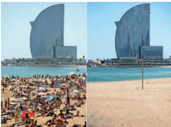
▲西班牙巴塞羅那海灘13日與疫前盛況對比

斐濟、約旦、克羅地亞、毛里求斯、黑山、巴拿馬、墨西哥、菲律賓、烏拉圭、牙買加、摩洛哥、泰國、匈牙利、洪都拉斯、馬來西亞