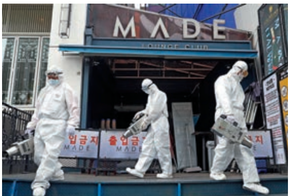
▲韓國工作人員15日對梨泰院夜店附近消毒

韓國統一部14日還透露，韓國民間團體援助的洗手消毒液本月上旬運抵朝鮮，防護服援助工作正在進行當中。統一部3月31日批准一個價值1億韓圓（約63萬港元）的洗手液援助項目，4月23日又批准價值2億韓圓（約126萬港元）的2萬套防護服援助項目。