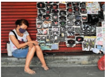
▲泰國小商販15日因無顧客關顧而打盹

一些專家預計疫情對旅遊業的衝擊將持續一年左右，但對旅遊的持續影響尚不清楚。標普稱，克羅地亞和匈牙利，也許能夠在二、三年內較好地復甦，但商務旅行將會持續疲軟。金融服務公司Tellimer的新型市場管理經理馬利克（Hasnain Malik）指出，「消費者被禁足好幾個月後，可能很渴望出遠門，但是企業可能會持續傾向於視頻會議而不是出差。」