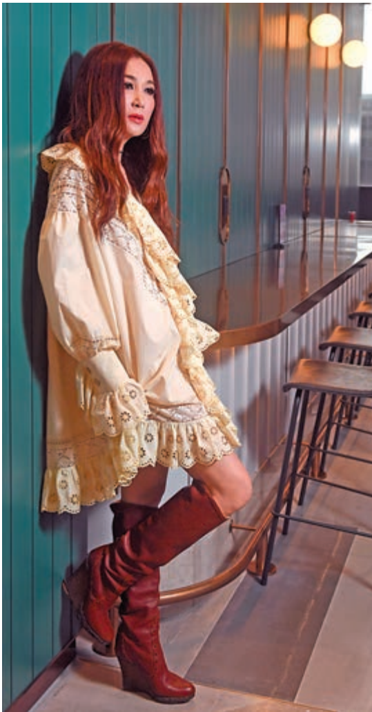
▲溫碧霞希望嘗試不同的角色