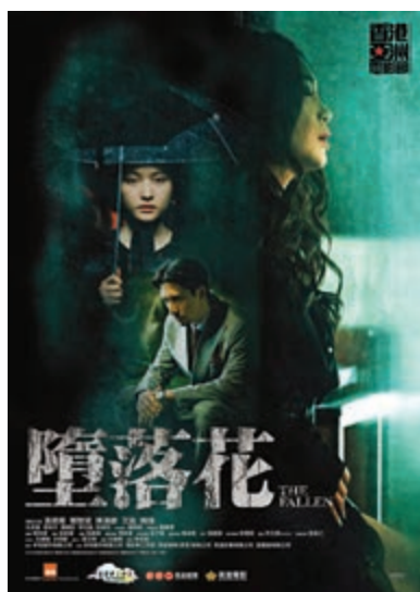
▲《墮落花》將於五月尾上映

「最佳女主角」，這是她第一次得到女主角的獎項，初嘗「影后」滋味。演技獲得肯定，問到會否有吐氣揚眉的感覺呢？她笑說：「其實我提名過好多次，第一部戲《靚妹仔》已經入圍金像獎『最佳新演員』，《出埃及記》又在西班牙影展獲『最佳女配角』提名，我亦在澳門拿過女配角獎項。今次是第一次獲女主角獎，也是我第二個獎項。我覺得自己還有很多空間，這一刻我對自己更有信心，始終經歷過這麼多，拍了這麼多戲，每一部戲都有得益，演技是要演的。從小到大我對自己有要求，演技亦早已被人肯定，只是未有攞到真正的獎項。」