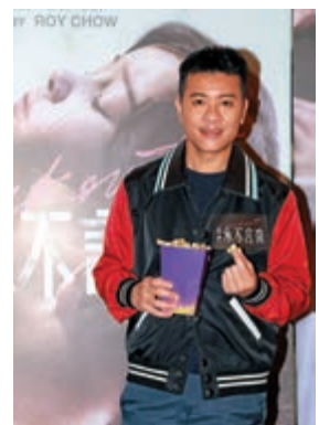
▲梁漢文出席首映活動

梁漢文最近體重大增至一百五十五磅，為了十月舉行的演唱會，他請教了身邊多位朋友，取得減肥秘笈。他首先採用了鄭秀文提供的菜湯減肥法，很快便瘦了六磅，現時其目標是減十幾磅。廖碧兒則表示，最近忙於在家拍片，剪髮片，亦有在網上教網民下廚。