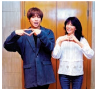
▶姜濤(左)邀請鄭裕玲拍攝短片

姜濤說：「衷心感謝每位前輩二話不說便幫手，特別要多謝Do姐。」他表示，沒想過Do姐一口答應，還認真學習舞步。姜濤希望透過今次的短片，提醒大家要忍耐，很快大家便不用蒙着嘴說愛你。