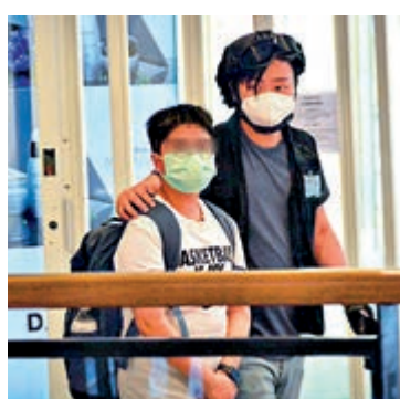
▲亂港分子上週母親節在海港城聚集及搞事，其間一名學生記者、12歲男童被帶返警署調查

勞工處於上週四（14日）向《深學媒體》發電郵稱，勞工視察科正跟進事件，並引用《僱傭條例》第57章，要求媒體負責人在本月20日前聯絡協