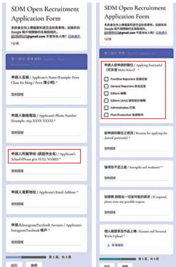
▲《深學媒體》的網聘表格要求應聘者填寫所屬學校的全名（左圖紅框示），以及應聘的職位，包括前線記者、編輯及後期製作等等（右圖紅框示）

【大公報訊】記者陳文俊報導：自稱網上媒體的《深學媒體》安排12歲學生記者，採訪暴徒於尖沙咀海港城聚集，涉嫌聘請童工，勞工處昨日回覆《大公報》查詢稱，已收到《深學媒體》的回覆，處方在跟進有關事宜。