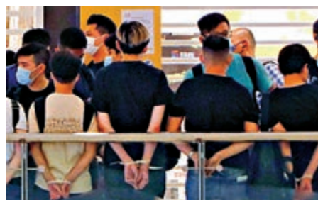
▲有人昨日在東港城「和你shop」涉非法集結、襲警，八人涉案被捕

有人參與未經批准集結，遂進入商場警告集結群眾離開，但部分人士拒絕聽從警告並起哄叫罵，警方於是採取執法行動，並拘捕八人分別涉嫌「非法集結」、「襲警」及「阻差辦公」罪。