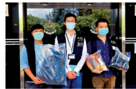
▲警方在東涌拘捕一名女子，涉虛報機場有炸彈，行動中檢獲一批證物

度博瀚又指，留意到近期類似「炸彈嚇詐」案件有上升趨勢，譴責涉案者行為不負責任，除浪費人力物力，對市民亦構成不便。他強調「炸彈嚇詐」為極嚴重罪行，一旦罪成，可判最高罰款15萬元及監禁5年，警告市民切勿以身試法。