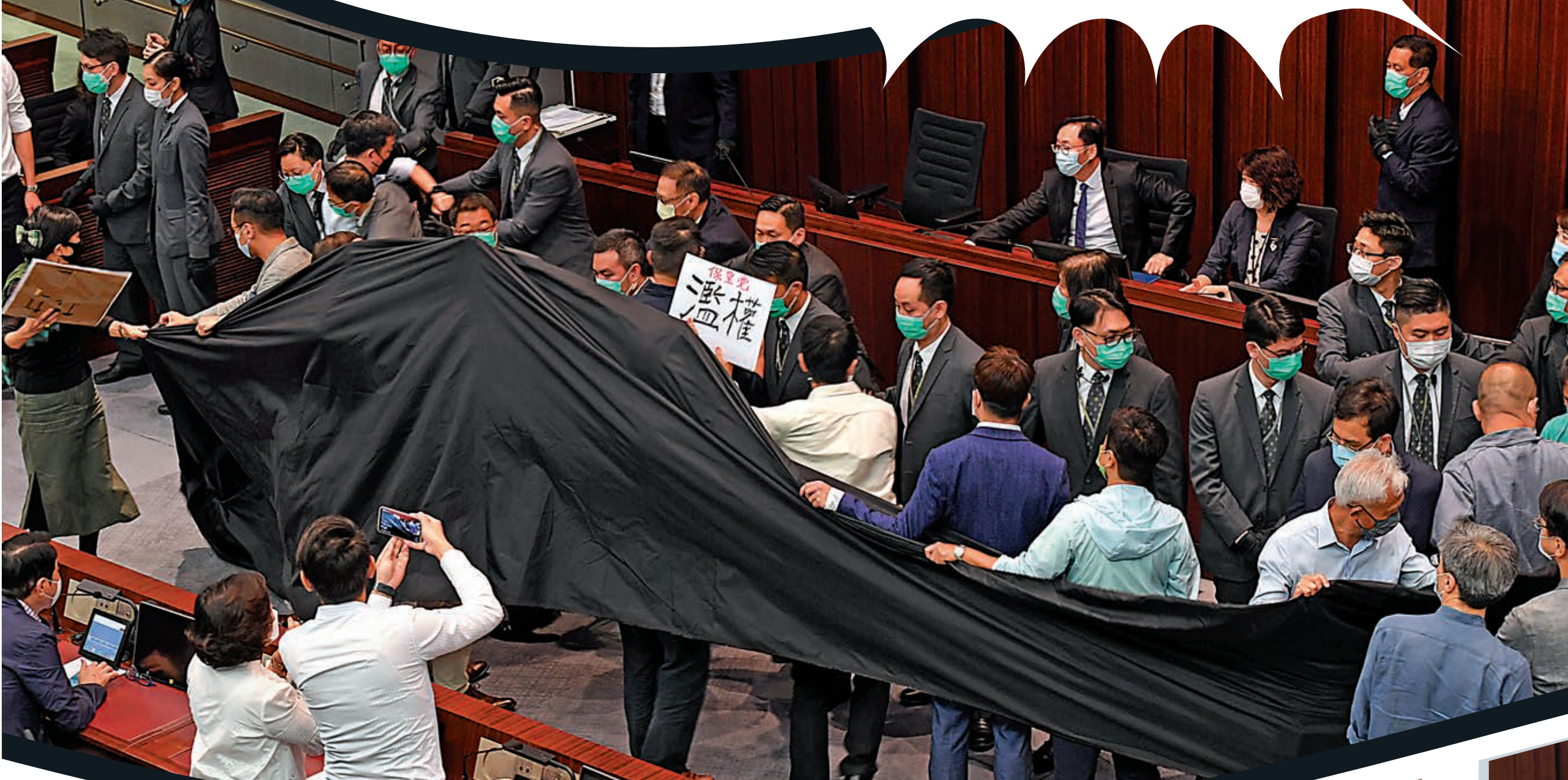
▲反對派議員昨日拉起一幅巨型黑布，試圖以此遮掩他們的黑暴行徑