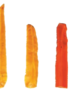
▲新樂下層文化——石叶

，因見於遺址的上部土層中，故命名為「新樂上層文化」。遺址出土了一批以磨製石器、素面三足陶器、鬲為主要代表的遺物。新樂上層文化距今約四千至三千年，是下遼河流域最早被識別的青銅時代考古學文化。隨後，瀋陽市內北部的新樂遺址地區以及市郊的瀋北、東陵和新民、法庫、康平等地區陸續發現新樂上層文化遺址四十餘處。大體分佈於下遼河流域的渾河、蒲河、沙河兩岸的台地或河漫灘地上。