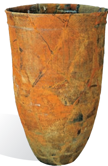
▲新樂下層文化——壓印「之」字紋陶罐

「之」字紋深腹罐器形呈深筒狀，多為直壁、敞口、平底，也有稍敞口或侈口，腹壁微弧。器表飾有結構緊密的壓印「之」字紋，主要用來存儲或烹煮食物。斜口器為扁平體、斜口、橢圓形器底，其用途可能是移植或保留火種或撮取火種的工具。刻畫高足鉢的出土數量少，但製作精良，應屬生活器皿。