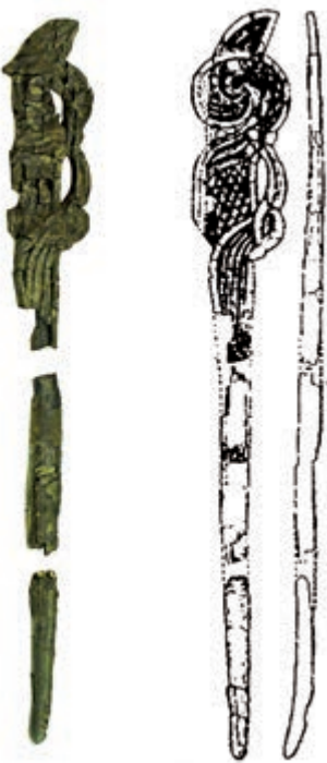
▶新樂下層文化——炭化木雕（左）和木雕墨線圖（右）