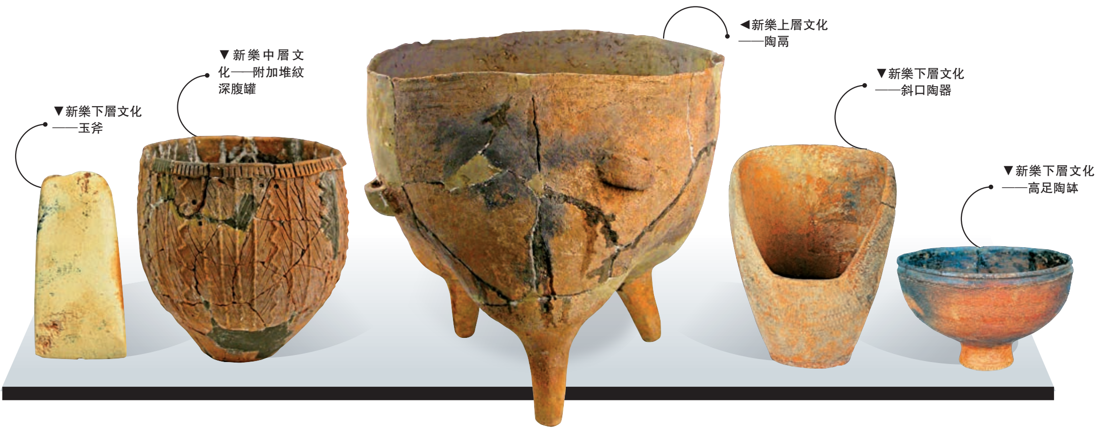
▼新樂下層文化——玉斧