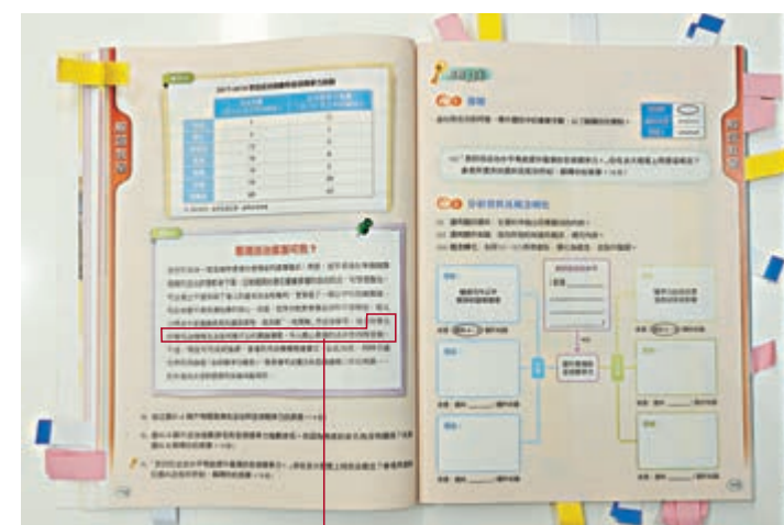
大釋法令當選議員喪失議員資格，就高舉「一地兩檢」作出安排等，加上社會上抨擊司法機構及法官判案不公的輿論湧現，令人擔心香港的法治會因而受損。

人士的批評，質疑人大常委會決定通過「一地兩檢」是「缺乏法理基礎」、又誣稱人大解釋基本法是「演繹、補充，甚至修改本地法例，危及本港司法獨立」云云。而題目更露骨地要求學生「解釋引致公眾認為近年本港法治受損的因素」，被質疑讓學生「未審先判」，影響學生的正常思考和判斷。