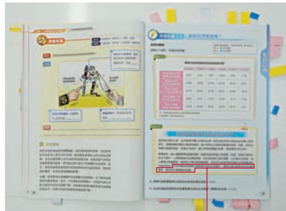
▼教材先埋伏定論「政府施政引致社會爭端」，其後借用法官判詞渲染違法「佔中」的所謂「公民抗命」是「光榮」

有意見質疑，正常通識科的文字資料題，多會引用媒體報道說明一件事，當中應包含多角度立論和不同持份者的見解。然而該教材無論從資料概述，再到出題，都有明顯的引導性文字，讓學生吸收單向的資料，無法培養多角度的思考和全面審視事件的能力。