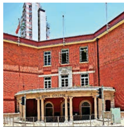
▲名官中英皇書院是其中一間選用「雅集通識」作通識參考教材的學校

【大公報訊】記者殷向善報導：香港通識科教材缺乏監管，以致近年來連連被揭發「毒教材」滲入校園，毒害學生。《大公報》記者調查發現，官立學校本學年（2019/2020）的教科書單中，居然也出現上述通識