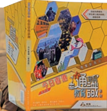
▲《雅集新高中通識教育系列——今日香港（第四版）》內容充滿偏頗和引導性意見

事實上，文憑試通識「毒教材」遍布坊間。大公報記者翻閱其中一本《雅集新高中通識教育系列——今日香港（第四版）》及其快速溫習手冊，該教材由雅集出版社於2018年出版，內容充滿偏頗和引導性意見，專家直言，這樣的教材用上糖衣包裝，內容卻與毒品無異，毒害青少年，政府必須關注。