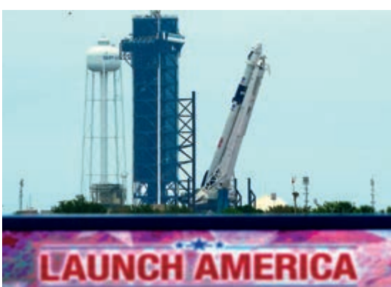
▲「獵鷹9」火箭和「龍飛船」26日在佛州卡納維拉爾角發射場作發射前準備

不過，與俄合作升空不同，美國逐漸往爭奪太空霸權的方向邁進，不僅在新月球開發國際框架協議《阿耳忒彌斯協議》中，允許各方在月球設立「安全區」，形同在外太空搞「圈地運動」。SpaceX公司還宣布將全面啟動「星鏈計劃」，預計向太空發射多達1.2萬顆微型衛星，勢必對其他國家的航天器造成影響。