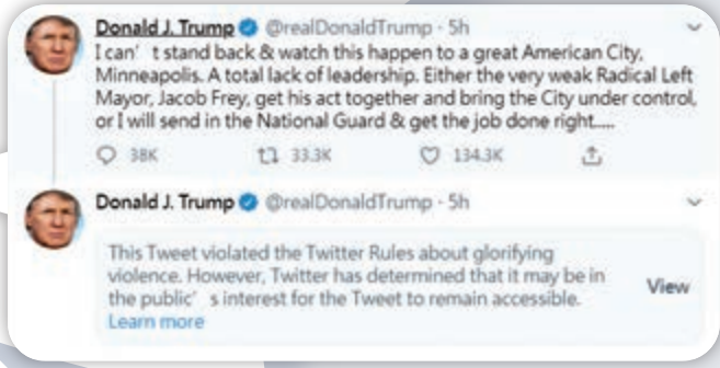
◀特朗普推文因「美化暴力」被推特隱藏 網絡圖片