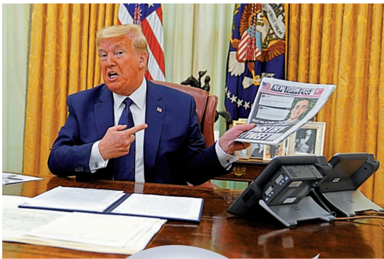
▲美國總統特朗普28日簽署行政令前展示《紐約時報》