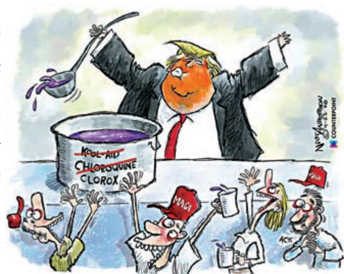
▲漫畫家尼爾森創造的諷刺漫畫