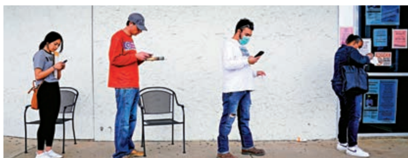
經濟學家預計，本月美國失業率仍逼近20%

還有最重要的是，仍有不少美資大行，包括高盛、摩根士丹利等希望在中國繼續發展，還有在澳門的美資賭場，也是在中國的領土，若把在澳門的中資企業都趕走，難道中國便不能做同樣的事情嗎？美國真可謂「殺敵一千，自損八百」。