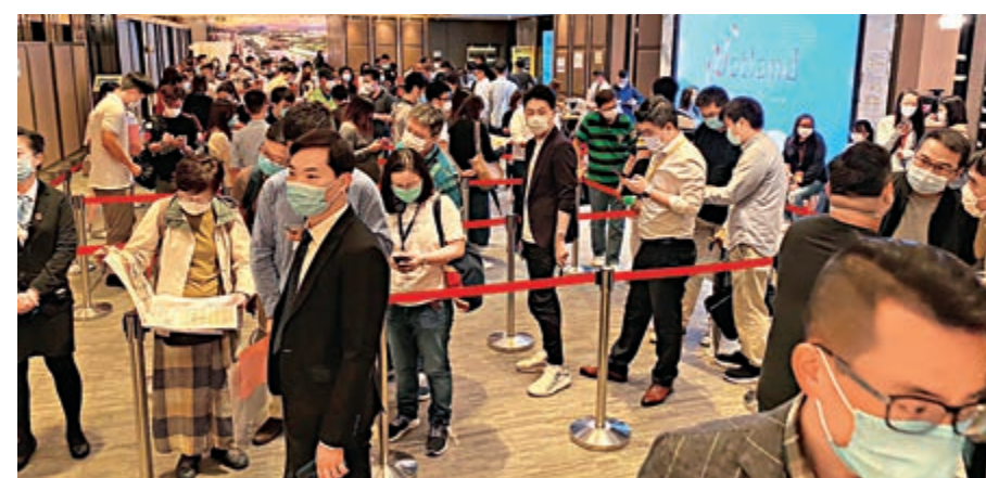
Wetland Seasons Park第2期次輪開賣，準客戶魚貫到場

對於美國總統特朗普宣布啟動取消香港特殊貿易地位，陳認為，商界將首當其衝，故大銀碼的及豪宅盤會