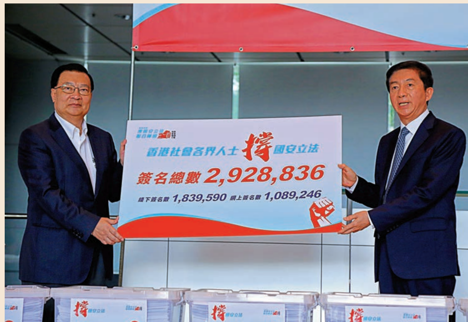
▲香港各界撐國安立法聯合陣線召集人譚耀宗向中聯辦主任駱惠寧遞交近三百萬人支持特區國安立法的簽名冊