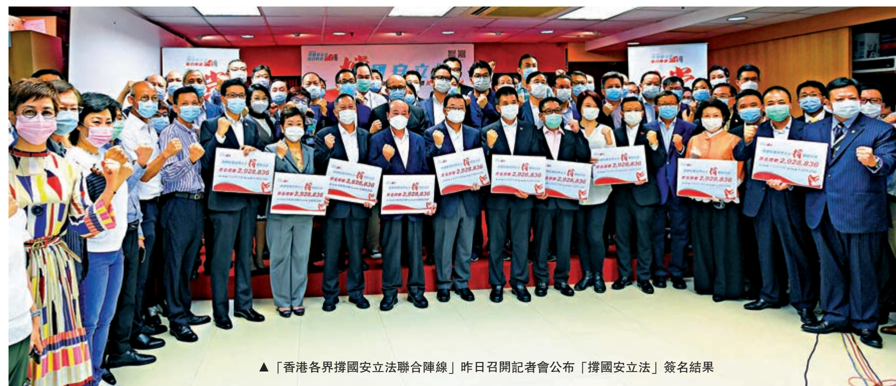
▲「香港各界撐國安立法聯合陣線」昨日召開記者會公布「撐國安立法」簽名結果