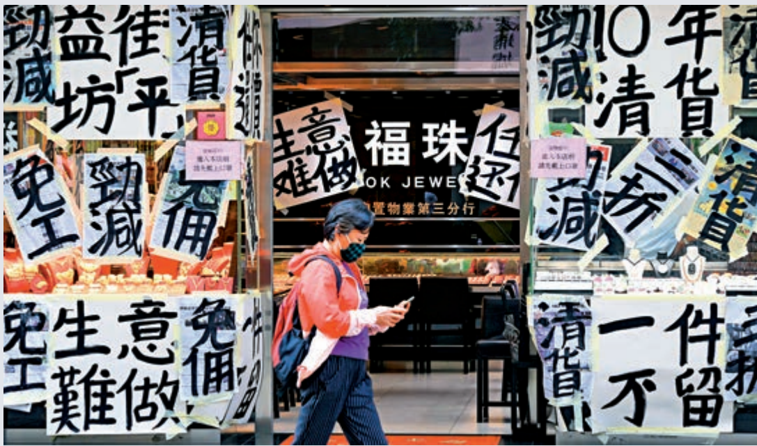
▲遊客絕跡，珠寶首飾、鐘錶及名貴禮物等奢侈品店鋪繼續成為重災區