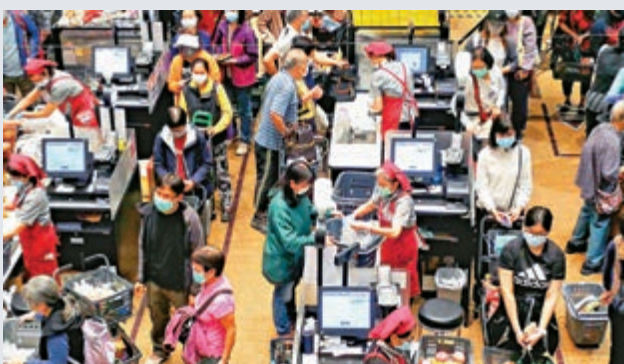
▲超市銷售情況略有好轉