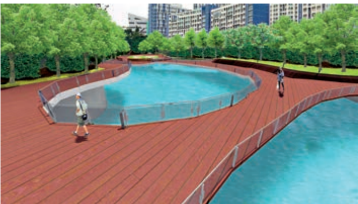
◀規劃中的石硤尾公園地下蓄洪池 採用開放式設計 模擬圖