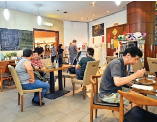
▲膳心小館不獲續租，卻將本身經營不善問題推卸給房協，說成「政治打壓」

房協已於5月30日向膳心小館發出通知書，說明合約期滿後終止。膳心小館得悉不獲續約後，在Facebook將事件「無限上崗上線」，既說房協「政治打壓」，又說「千方百計破壞黃色經濟圈」等，懶理他們本身經營不善問題。