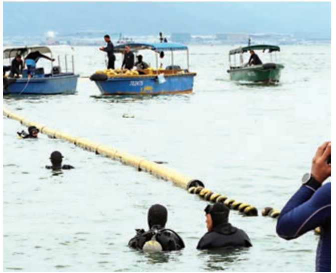
▲八名康文署外判潛水員到泳灘找尋鯊魚及檢查防鯊網

90年代在西貢海域，曾於兩週內發生3宗鯊魚咬死泳客事件，1995年5月31日，一名44歲體育老師於小棕林石灘潛水期間，其右腳至臀部被鯊魚咬至齊肢斷去死亡，其後再有兩名市民分別在相思灣和清水灣被鯊魚咬死，當局其後斥資過億元，陸續在轄下的泳灘加設防鯊網。