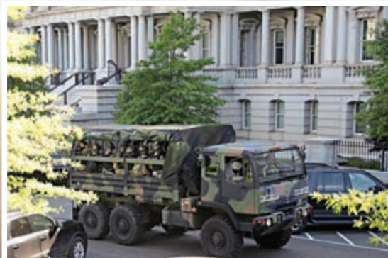
▲華盛頓特區國民警衛隊1日進入白宮