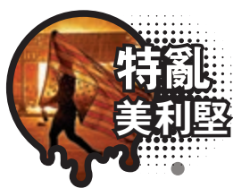
▼白宮附近的示威者5月31日晚與警方發生激烈衝突

此外，兩名法醫為弗洛伊德進行獨立屍檢後指，弗洛伊德是窒息致死，認為事件是謀殺，與當局原先指弗洛伊德可能死於其他基礎病的說法有出入。