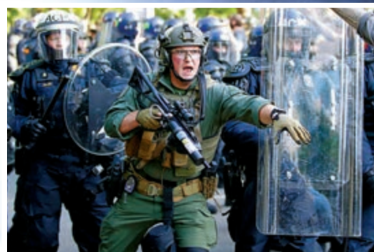
▲警方1日在白宮外武力清場，驅散數千名和平示威者