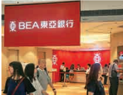
▲東亞被傳預備出售旗下所有業務，但東亞其後否認傳聞

根據原有時間表，東亞原定於6月30日之前公布檢討結果。不過，受到新冠肺炎疫情影響，東亞董事會認為需要額外時間處理，故此將時間表押後至9月底。