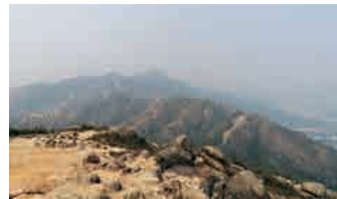
▲站在靈渡山，看杯渡山

繼續往前走，可見屯門堆填區，附近海灘下白泥則是觀日落的著名景點。流浮山距此不遠，海鮮不可錯過。