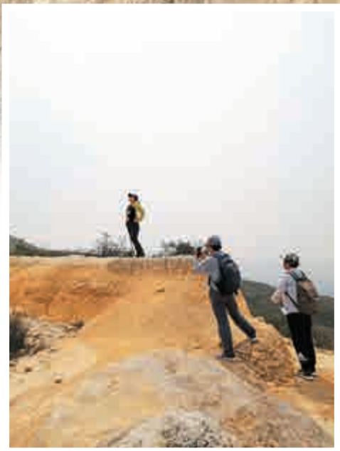
▲登山者駐足拍照打卡

樹，亦因此群山逶迤，無掩無遮，一覽無遺。大青山之得名，想必是一片「青草山」之意。