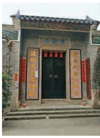
▲靈渡寺是香港最早的寺廟