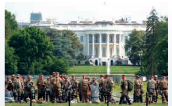
▲美國軍人6日駐守在白宮前

【大公報訊】據哥倫比亞廣播公司（CBS）報道：美國黑人弗洛伊德遭白人警員壓斃死亡引發全美連日騷亂，總統特朗普揚言出動現役軍人鎮壓的言論引發爭議。CBS透露，特朗普1日曾要求立即出動1萬名現役士兵鎮暴，但司法部長巴爾、國防部長埃斯珀及參謀長聯席會議主席米利均表示反對，氣氛一度劍拔弩張。最後為了滿足特朗普，埃斯珀及米利不得不致電各州州長，