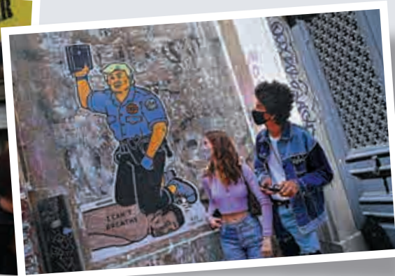
▲巴黎民眾6日走過一幅諷刺美國總統特朗普種族歧視的壁畫