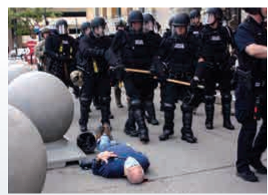
▲美國水牛城警察4日推倒75歲示威者

這兩名警察於6日被起訴二級襲擊，一旦罪名成立，最高可被判入獄7年，不過兩人均不認罪，獲准自簽擔保候審，7月20日再應訊。