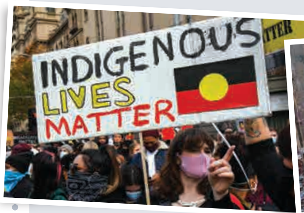
▲澳洲墨爾本6日抗議中，示威者高舉「原住民的命也是命」的標語

說白了，種族歧視是美國社會的瘡疤，也是西方國家的共同恥辱，企圖搞「雙標」無法明哲保身，迴避搪塞也解決不了問題。聯合國人權事務高級專員巴切萊特發表聲明指出，美國的「結構性種族主義」和「刺眼的平等」是引發大規模抗議活動的核心，現在是進行「深遠改革」的時候了。一些模仿美國「防疫」的西方國家，已經在抗擊疫情上跌了大筋斗，如今在反對種族歧視問題上，難道也要像美國那樣繼續跌筋斗嗎？