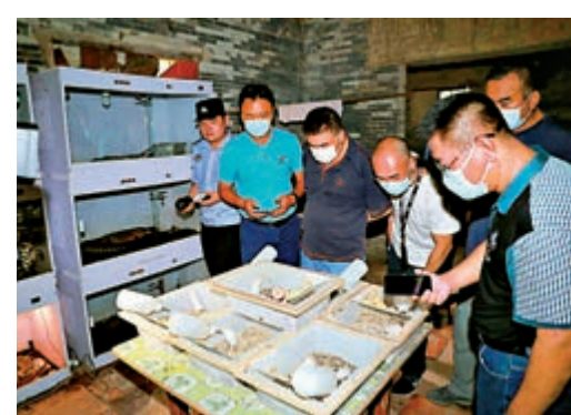
▲江門警方偵破一宗非法收購出售野生動物及其製品案件。

廣東省公安廳有關負責人表示，警方將圍繞「捕、養、售、運、食」五個環節，對涉野生動物違法犯罪案件快偵快辦、一查到底，切實形成全鏈條打擊的高壓震懾態勢，堅決遏制涉野生動物違法犯罪高發勢頭。