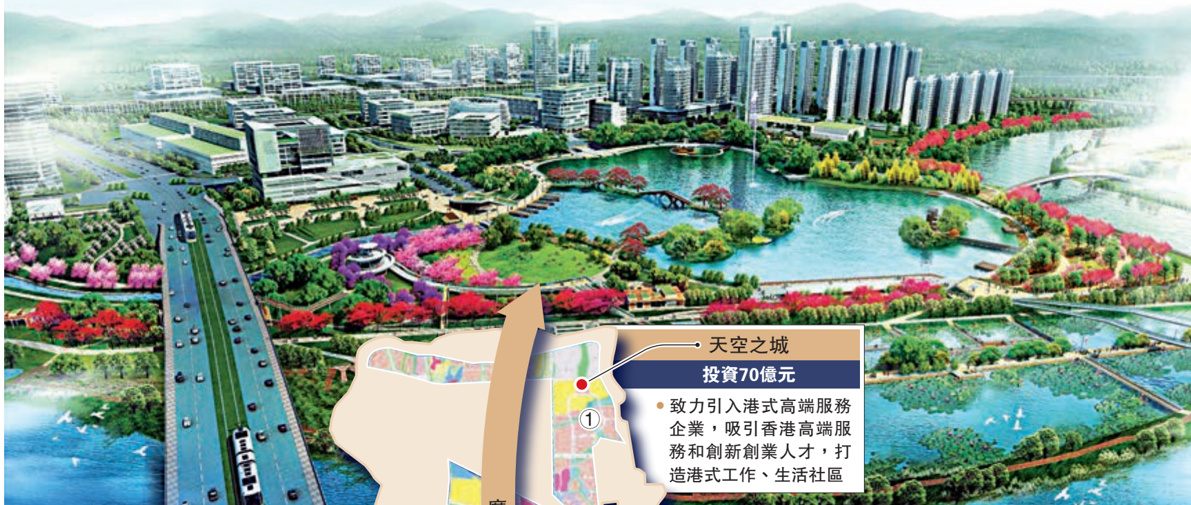
位於三山新城的天空之城將打造港式社區，吸引香港雙創人才。圖為三龍灣南海片區三山新城示意圖。

天空之城項目還將吸引香港高端服務和創新創業人才，打造港式工作、生活社區。記者梳理資料發現，「香港城」項目早在地塊出讓時，就在配建要求註明：「須配建住宅向港澳居民銷售，並且需要引入香港的一些產業元素。」在教育配套方面，當天還簽約了一個「三龍灣國際學校」項目。學校佔地約24畝，計劃引入一家知名國際教育機構，將採用全球通用的IB（國際文憑組織）或AP（大學預修課）課程。將提供全鏈條教育，為三龍灣順德片區乃至周邊區域含港澳台居民在內的國際人才子女提供優質教育。