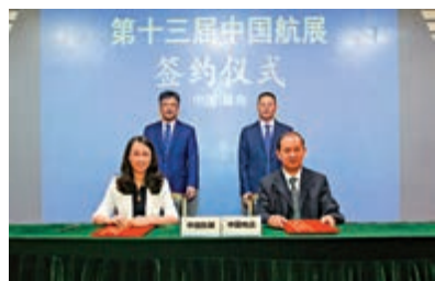
▲中國電信與中國航展簽約。

【大公報訊】記者帥誠廣州報道：9日，第十三屆中國國際航空航展博覽會（下稱「中國航展」）在珠海舉行了第二場簽約活動，墨西哥航展與中國航展線上簽約，截至目前，本屆中國航展已有近500家國內外知名航空航天企業確定參展。