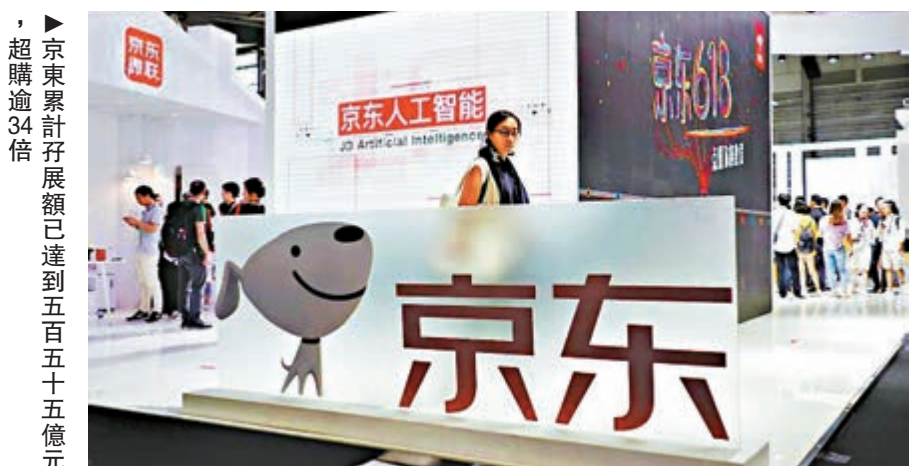
▲京東累計孖展額已達到五百五十五億元，超購逾34倍

截至今年3月末，京東的年度活躍用戶數由2019年末的3.62億，進一步提高至3.874億；京東的商品交易額(GMV)由2011年的327億元，大幅擴大至2019年的2.0854萬億元，複合年增長率達到68.1%。2016年至2019年期間，其淨收入的複合年增長率達到了31%，成為了增長最迅猛的中國零售業，增幅甚至高於美國最大零售商沃爾瑪(WMT)的3%和亞馬遜(AMZN)的29%。