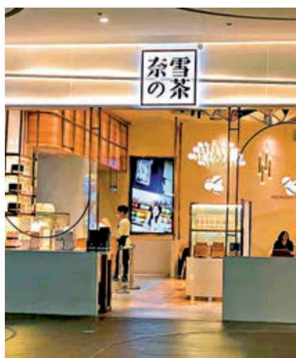
▲內地茶飲品連鎖店「奈雪の茶」IPO上市地由美國轉至香港

【大公報訊】據內地媒體引述消息稱，內地茶飲品連鎖店「奈雪の茶」IPO上市地由美國轉至香港。據悉，奈雪の茶即將完成一輪近億美元的融資，領投方為深創投。這距離其上一輪2018年3月公布的A+輪融資已兩年有餘。