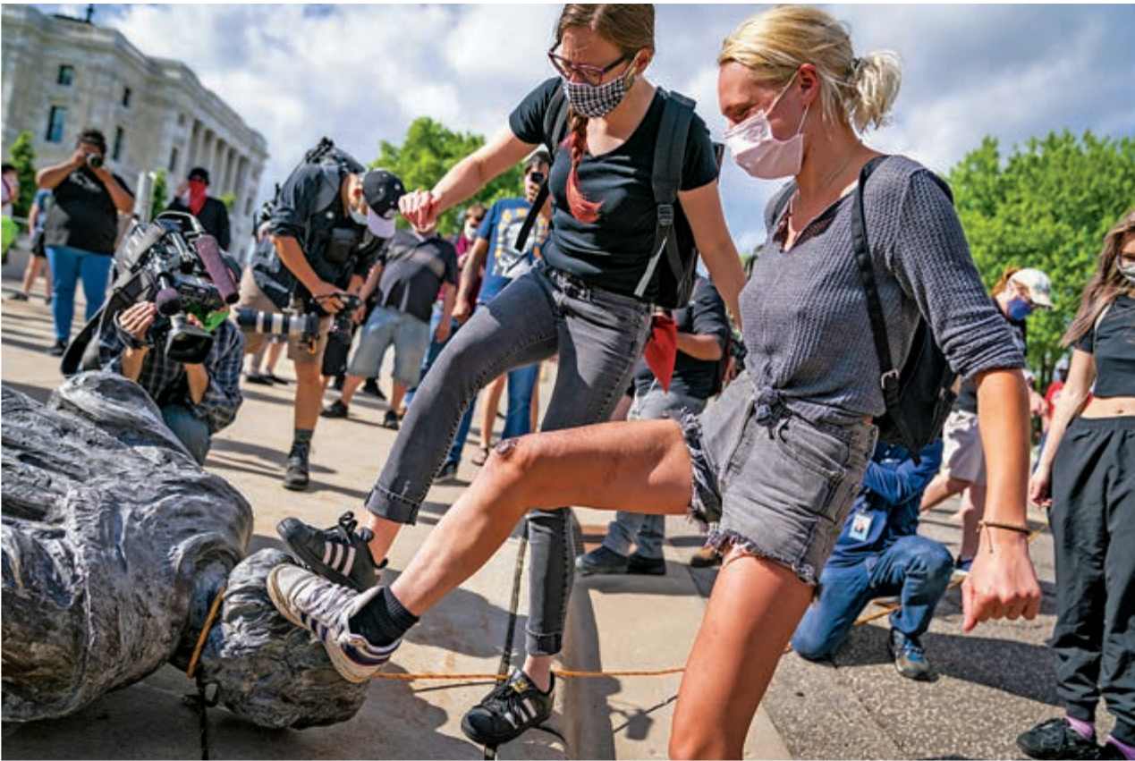
▲美明尼蘇達州示威者10日腳踩哥倫布雕像

《韋氏詞典》的編輯斯科洛夫斯基證實將應米徹姆的要求修改該定義。斯科洛夫斯基稱，詞典的第二個定義已將其定義為「基於種族主義假設，並旨在執行其原則的政治方案」，以及「建立在種族主義基礎上的政治或社會制度」。另外，與種族主義有關或具有其內涵的詞語的定義也將被更新。