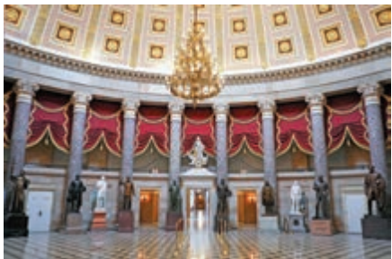
▲美國國會山中陳列的歷代領導人雕像

命令，將美國境內日本裔民眾趕入集中營。她質問道：「華盛頓和傑斐遜是否都應該被從歷史中除名？羅斯福