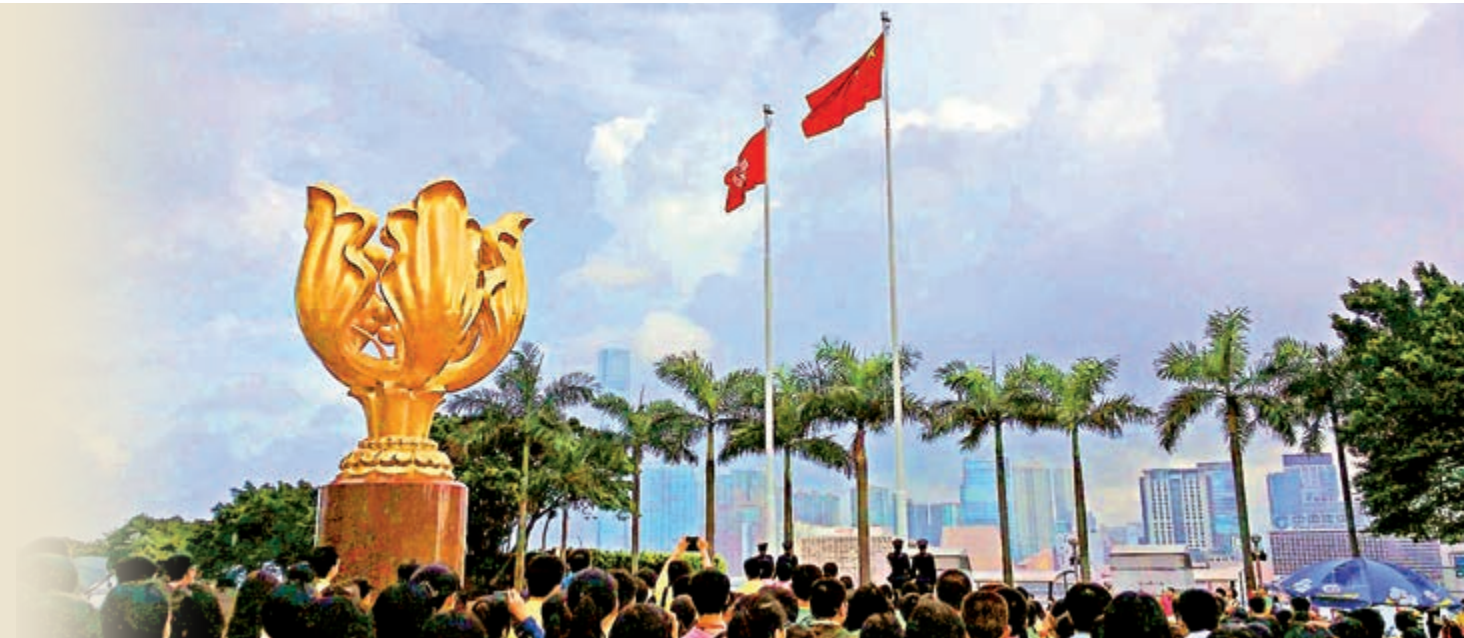
香港不論在回歸前和回歸後都奉行「行政主導」，「三權」從未真正分立。