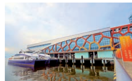
▲10日起，蛇口郵輪母港將正式恢復運營蛇口至澳門的高速客輪航線

在兩地檢疫要求方面，深圳去往澳門的旅客針對澳門居民、內地、香港和台灣居民以及外國人分別設有不同的入境檢疫要求，如若符合入境身份，應先申領「粵康碼」，用內建小程序轉換「澳康碼」，澳門方面對「粵康碼」中的核酸檢測結果等信息予以認可。