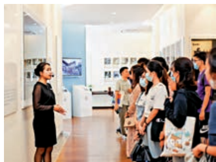
▲澳門青年到珠海參觀考察

【大公報訊】記者方俊明珠海報道：8日，2020年珠海首屆「容閩杯」創新創業挑戰賽啟動報名，面向全球留學人才、港澳台人才徵集創新創業項目，參賽對象須為留學回國人員或港澳台居民，且為團隊核心負責人。優勝團隊將給予相應賽事獎金及最高500萬元創業項目落地資助。