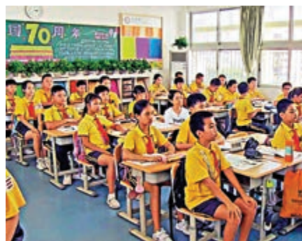
▲羅湖港人子弟學校採用「兩文三語」教學，集兩地優勢課程