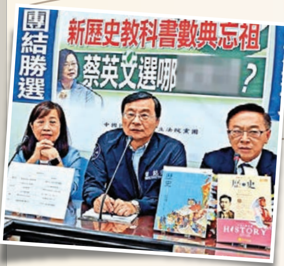
▲國民黨立委批評民進黨當局在教育領域搞「去中國化」