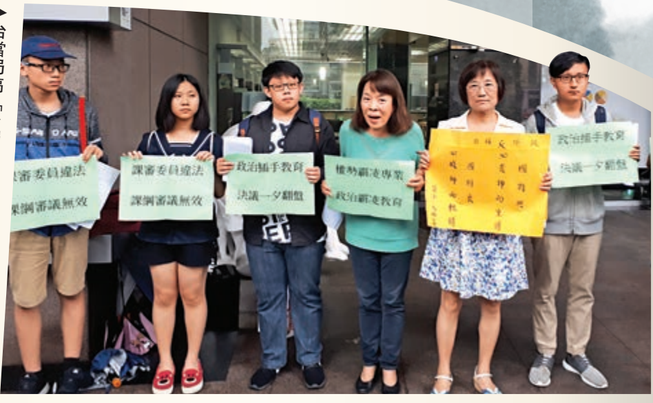
▶台當局搞「台獨」教育引發島內民衆不滿。圖為民衆抗議台當局刪減文言文內容。資料圖片

【大公報訊】綜合台媒及海外網報道：翻開台灣新版初二上學期歷史課本，以「翰林版」而言，第一章「從商周到隋唐的國家與社會」正文僅短短4頁，其中「從部落到封建」這一小節沒有講夏朝，只講商朝到西周，600年歷史不到300字完成。