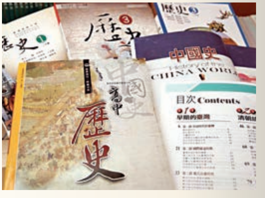
▲多年來台灣歷史課本充斥「台獨」思想上圖

島內輿論指出，歷史課本「去中國化」後，已有不少台灣學生自行去坊間找以前的歷史課本研讀，新版歷史全面弱化歷史，只會讓更多學生和家長「復古」起來。原因無他，人們天生有「希望知道事物終始」的求知慾！更何況，中國歷史源遠流長，不管是玩電子遊戲「三國殺」也好，看電影《花木蘭》也罷，都逃不過中國歷史的「如來佛掌」。