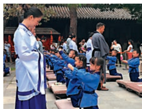
▲在文廟，孩子們給父母行三叩九拜之禮