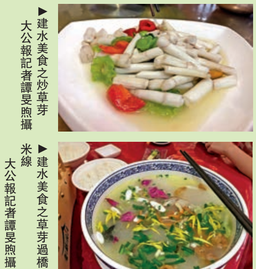
建水美食之炒芽