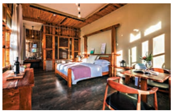
▲陽光透過窗戶曬到民宿房間裏倍感舒適