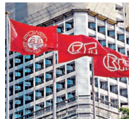
長和正考慮出售以色列第二大流動通訊商股權