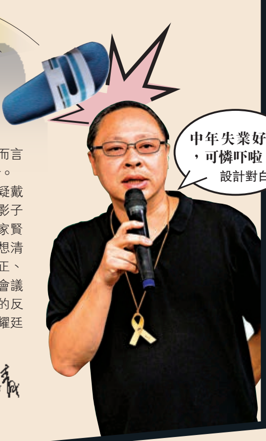
中年失業好慘，可憐吓啦！ 設計對白

此言一出，立即有反對派質疑戴耀廷是為了「拆大台」和建立「影子議會」。「民主動力」召集人趙家賢指平台無充足討論，應該三思，想清楚可行性和目的，他強調現時由正、副主席組成的「18區民主派聯絡會議」已經發揮效用云云。有心水清的反對派支持者亦在網上直言，「戴耀廷七月份搞『初選』已暴露他想操縱反對派的目的，今次借『總辭』對反對派落井下石，奪權之心係人都見到啦！」