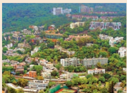
▲於香港國安法出台之前招標的美國駐港總領事館壽臣山物業接獲一份標書，但領事館發言人拒絕披露其中細節及詳情

於香港國安法出台之前招標的美國駐港總領事館壽臣山宿舍有眉目，領事館發言人證實，當地政府已接納一份標書，卻以交易進行中為由，拒絕披露其中細節及詳情，又預計交易可於年底前完成。