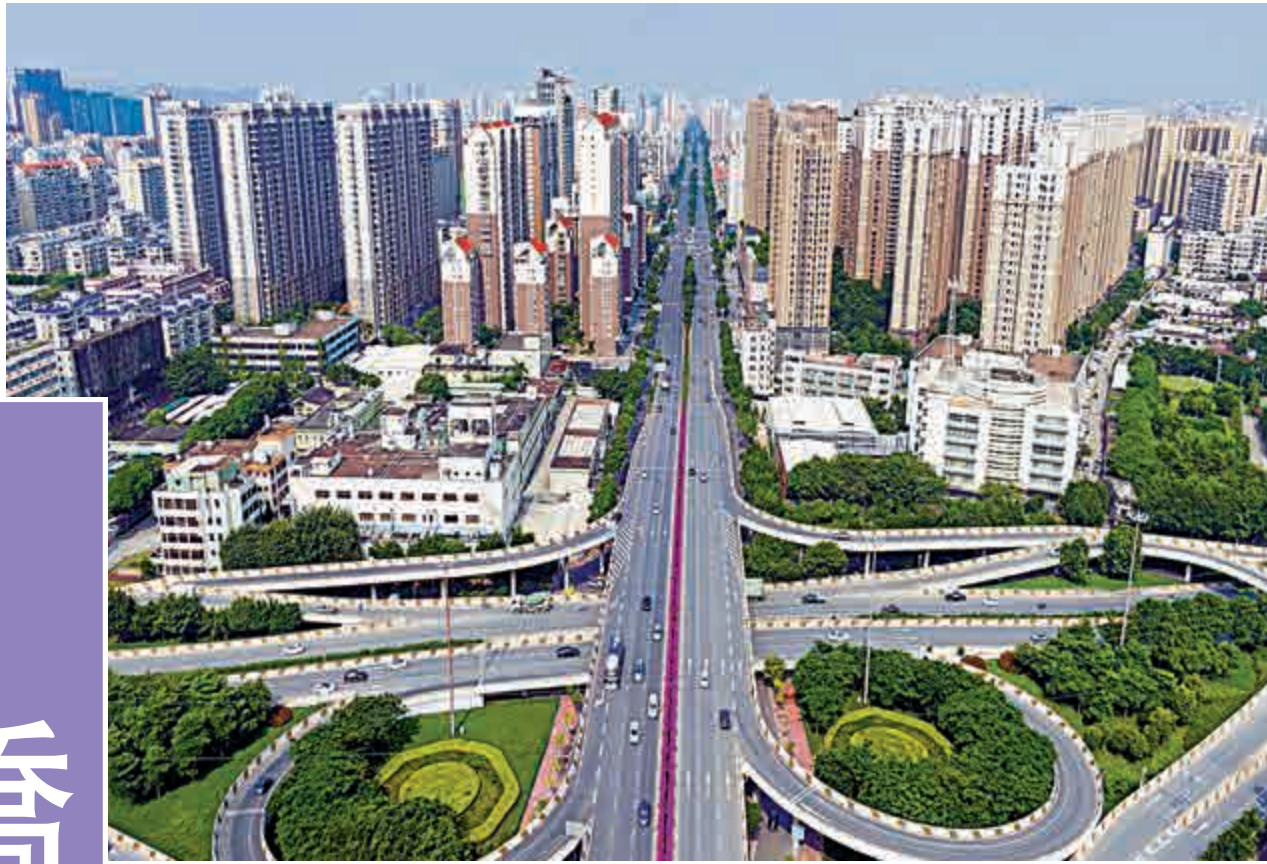
▲作為城市主幹道金沙路連接着汕頭特區的過去與未來

如今，汕頭經濟特區建設迎來40周年歷史節點，金沙路仍在不斷「成長」中。對汕頭人而言，不管是離鄉遠行還是千里歸家，車子都會行駛過金沙東路。正如粵東一名自媒體人所言，金沙路是每個汕頭人都會走過的大道。「她不像小公園一樣，已成為歷史回憶，她不是華僑試驗區，還在未來。她就像是連接過去與未來的通道，貫穿汕頭東西，延伸南北。」