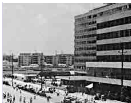
▲昔日通往特區的紅旗東路，即如今的金沙路

如今路過金沙路，會發現不少地段正在施工中。這條連接着汕頭的過去與現在的道路，依然在隨着城市發展而延伸，連接着汕頭的未來。作為汕頭布局