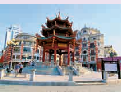
▲汕頭小公園開埠區保育活化正在開展

汕頭於19世紀60年代開埠通商，擁有大片騎樓群的開埠區曾是粵東商貿繁華之地。記者了解到，小公園開埠歷史文化街區將以「修舊如舊、修新如舊、建新如舊」的原則，以「老瓶裝新酒」和「新瓶裝老酒」的混合方式活化和創新現有資源。