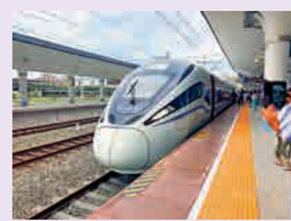
▲汕頭高鐵路開入市中心，帶動一業興、百業旺

旅遊業是「一業興、百業旺」的綜合性產業，一口氣帶動了「吃、住、行、遊、購、娛」全產業鏈的發展。原來汕頭市中心僅有金海灣大酒店等4家五星級酒店。而近期，全球知名酒店也在加速落戶汕頭。港人熟悉的洲際酒店集團，今年已啟動落戶汕頭的五星級酒店設計方案招標。而在汕頭華僑試驗區，正在規劃建設包括希爾頓酒店等3座五星級品牌酒店。