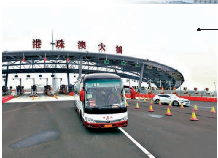
▲金琴快線建成後將連接至港珠澳大橋，節省路程時間 資料圖片