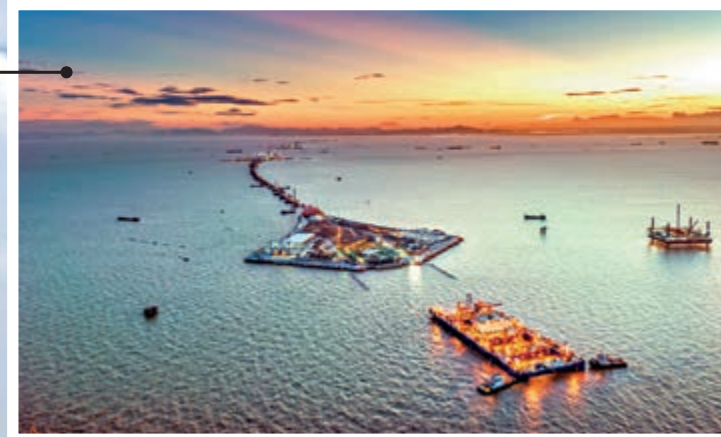
▲今年6月，深中通道完成歷史性的首次「海底初吻」，沉管隧道首節沉管順利實現與西人工島埋設段對接 網絡圖片