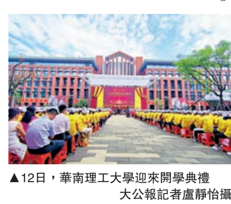
▲12日，華南理工大學迎來開學典禮

「學校在努力為留學生提供一個安全可靠的生活環境。每個老師和學生都在配合防疫政策。」