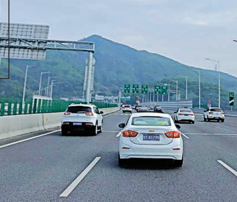
▲大灣區城市互聯互通加速，港人北上置業、投資增多

長度：4.3公里 目前進展：已先行開展橋樑樁基工程建設，全線將在深中通道2024年通車前完工