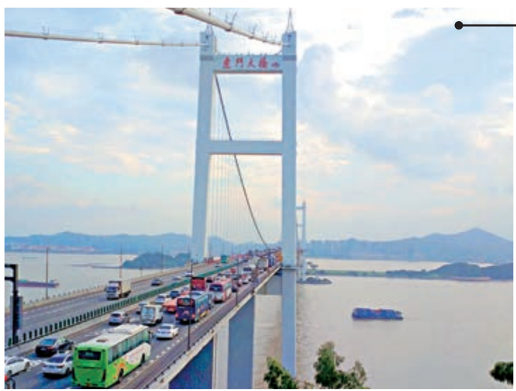
▲深中通道建成後，由香港去到珠江西岸可選擇耗時較少的深中通道，避開經常交通堵塞的虎門大橋