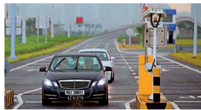
▲圖為使用港珠澳大橋的私家車抵達澳門口岸

同時，廣東大力發展智慧交通，推動5G、物聯網、人工智能等技術在交通中的應用，其中今年底全省高速公路ETC（電子不停車收費）通行成功率達到99%以上。而據省交通運輸廳新印發《廣東省高速公路網規劃（2020—2035年）》，到2035年，實現廣東高速公路里程達1.5萬公里，主要綜合交通樞紐和重點景區實現高速公路全覆蓋。