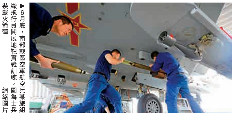
裝載飛彈 6月底，南部戰區空軍航空兵某旅組裝飛彈，開展地靶實戰訓練。圖為士兵

·卡特在2019年6月的一次演講中指出，美國在242年的建國歷史中僅有16年沒有打仗，堪稱「世界歷史上最好戰的國家」，美國在過去幾十年裏一直處於持續的戰爭之中，包括伊拉克戰爭、阿富汗戰爭、敘利亞戰爭及也門戰爭等。據統計，阿富汗戰爭造成超過4萬名平民死亡，約1100萬人淪為難民；伊拉克戰爭造成超過20萬平民死亡，約250萬人淪為難民；敘利亞戰爭造成超過4萬名平民死亡，660萬人逃離家園。美國政府還包庇縱容戰爭罪犯。