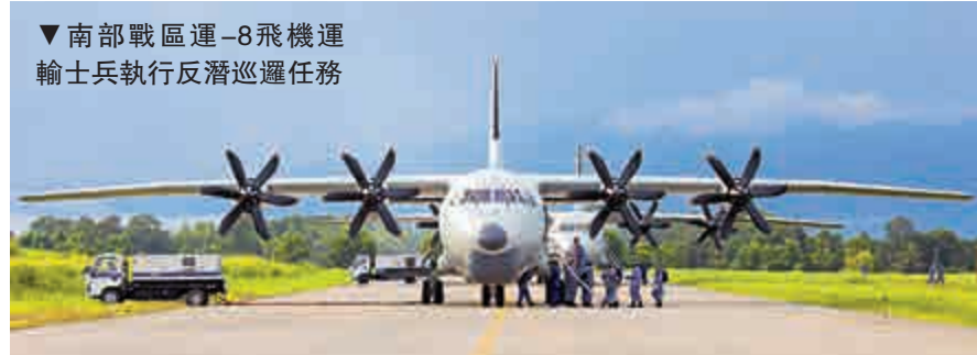
▼南部戰區運-8飛機運輸士兵執行反潛巡邏任務