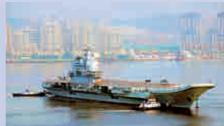
▲9月1日，國產航母山東艦從大連啓航赴渤海執行軍事任務 資料圖片

近期，山東艦在渤海進行艦機協同訓練，而遼寧艦也從黃海北上執行演訓任務。多家外媒認為，首次雙航母聯訓即將上演。雙航母組成戰鬥群，艦載戰機與驅逐艦、護衛艦可協同形成多平台作戰，攻防兼備，提高打擊能力。美國海軍近期就多次在太平洋海域舉行雙航母演習。山東艦、遼寧艦搭載的艦載戰鬥機和直升機合計超過70架，