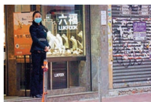
珠寶行業疫市期間，關閉部分店舖，縮短營業時間。

綜觀本地鐘錶股業績表現，英皇鐘錶(00887)上半年盈轉虧蝕1.14億元，東方表行(00398)純利下跌28.2%至不足1億元。