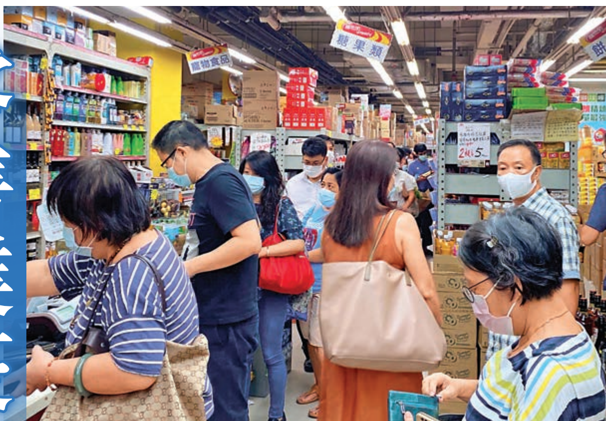
受疫情影響不大的零售板塊，包括民生家品、雜貨、便利店等相關股份，是零售業在疫市的奇葩。