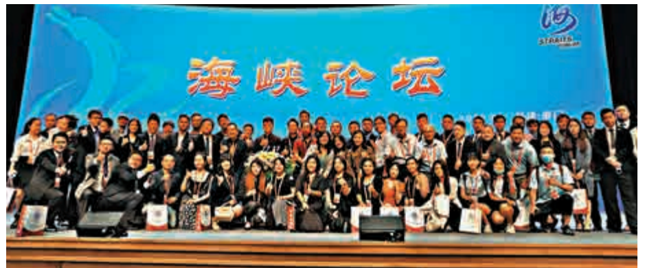
▲參加海峽論壇的台胞在台上合影

劉結一在座談會上表示，大陸取得抗擊新冠肺炎疫情重大戰略成果，包含着廣大台胞台企的重要貢獻，彰顯了團結奮鬥、百折不撓的民族精神。中華民族走向偉大復興的歷史腳步堅定向前，兩岸融合發展之路必然越走越寬廣。兩岸關係好，台灣同胞的利益福祉才有根本保障。希望兩岸青年不負韶華、克服困難、攜手奮進，做無愧於民族復興偉大時代的建設者。