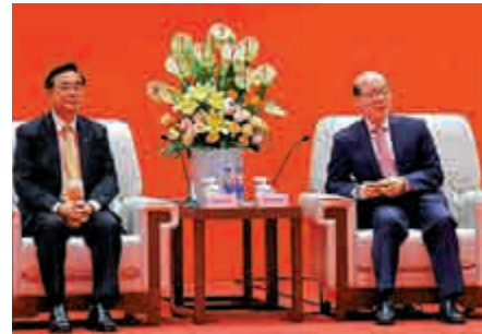
▲國台辦主任劉結一（右）20日會見新黨主席吳成典（左）

【大公報訊】據中新社報道：中共中央台辦、國務院台辦主任劉結一19日下午在廈門市海滄區走訪台灣青年參與鄉村建設情況並與在閩台灣青年代表座談，勉勵他們為中華民族偉大復興貢獻