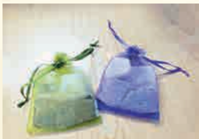
▲配有吳茱萸成分的香囊，有芳香辟穢、理氣解鬱及驅毒殺蟲的功效