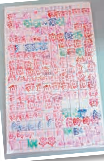
▲Carrie為女兒設計獎勵計劃

疫情下Carrie與女兒接觸時間延長，她認為適當制定規劃，不失為一個讓小孩掌握更多生活技能的好時機