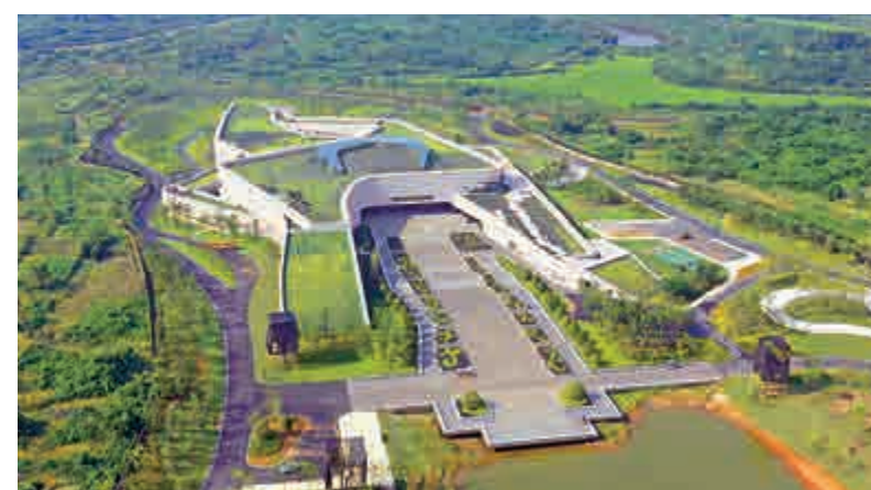
▲南昌海昏侯國遺址公園