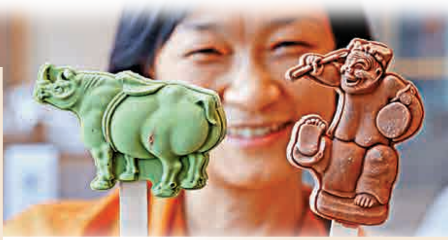
▲文物雪糕吸引眾多網友前來打卡拍照