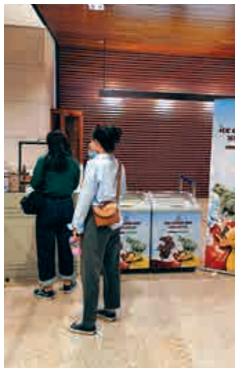
▲顧客前來打卡文物雪糕