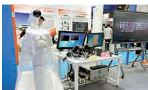
▲人工智能咽拭子機器人

果趨智能化。其中，人工智能咽拭子機器人第一代已用於臨床，包括隔離病區、發熱門診等。為應對常態化防控的檢測要求，二代機器人應運而生，準備投入使用。