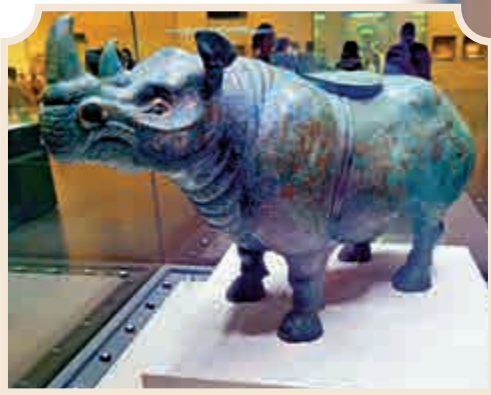
錯金銀雲紋青銅犀尊