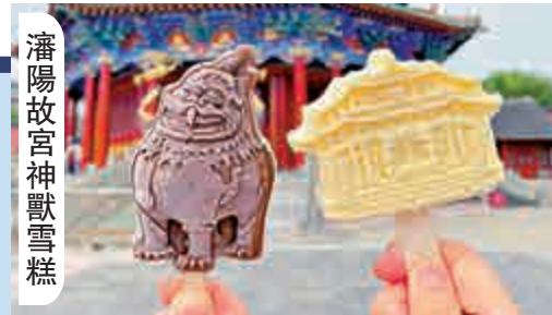
瀋陽故宮神獸雪糕