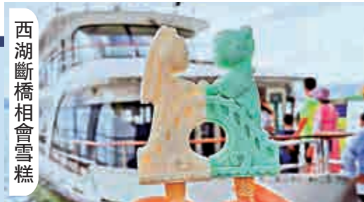
西湖斷橋相會雪糕