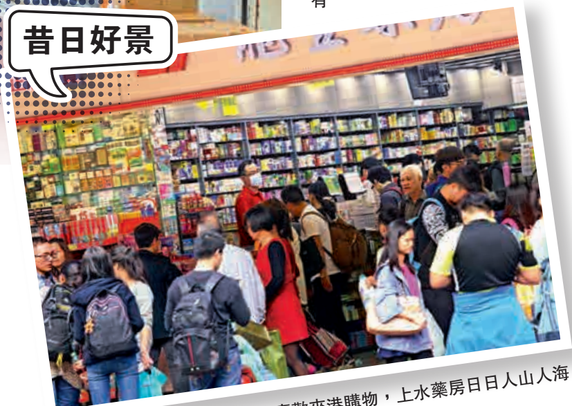
▲昔日內地旅客喜歡來港購物，上水藥房日日人山人海