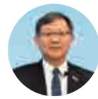
生產力促進局主席 林宣武