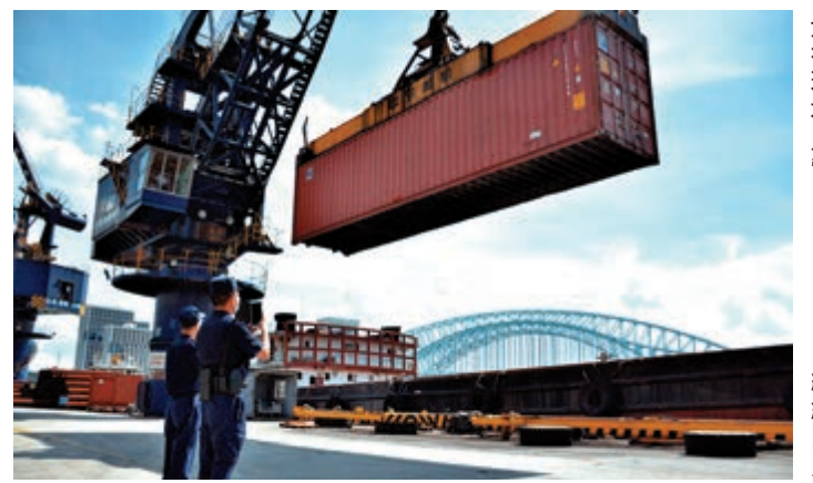
◀關員對即將運往廣州南沙港的貨物進行現場監管

同時，廣州港南沙糧食通用碼頭擴建工程主體建設亦進入快車道，新建2個10萬噸級通用泊位和1個4萬噸級件雜貨泊位等；完工後，該碼頭將形成擁有9個糧食及通用泊位、10個駁船泊位、港口岸線約3.6公里的大型深水港口碼頭，將成為粵港澳大灣區最大的糧食、鋼鐵、成套設備物流基地和木材、紙漿貿易中轉分撥基地，進一步推動廣州國際航運樞紐建設，更好保障區域糧食供給，提升糧食倉儲能力，保障國家糧食安全。