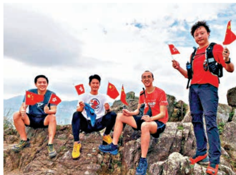
有香港青年自發登上獅子山，在山頂高唱國歌，揮舞國旗和區旗

隨後匯演開始，表演團體演唱「月亮代表我的心」、「獅子山下」等多首名曲，亦有配上激昂配樂的雜技表演，觀眾反應熱烈，氣氛亦達高點。