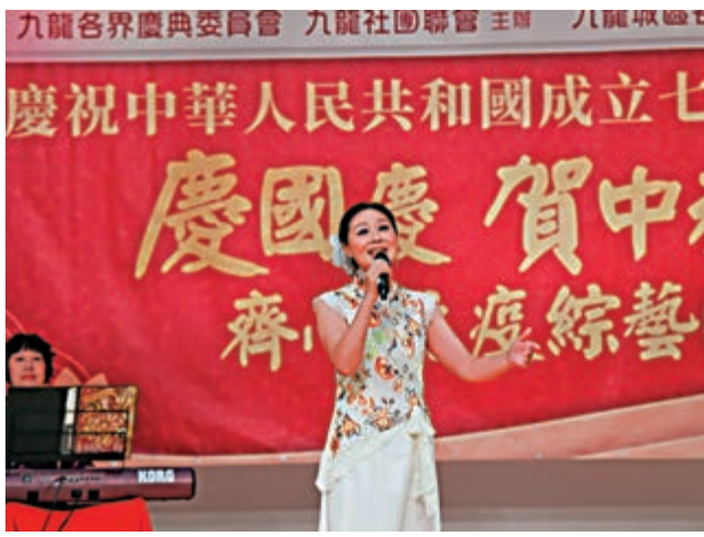
表演團體在台上演唱多首名曲