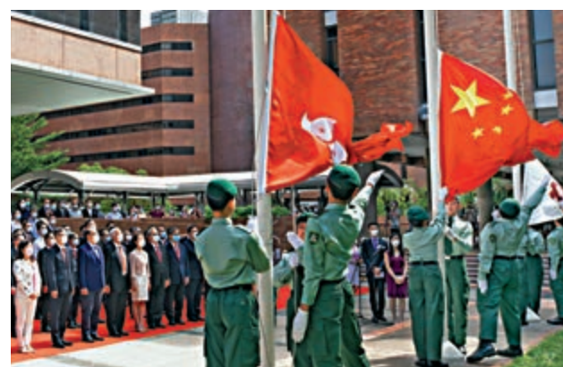
香港理工大學昨日於校園內舉行升旗儀式