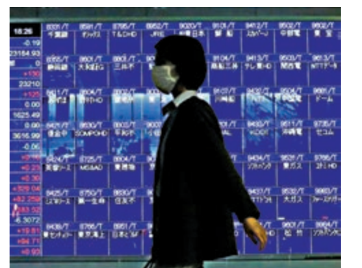
▲東京證券交易所交易系統出現嚴重故障，昨日罕見地全日停止交易

美股開盤後，宣布將按原計劃裁員的美國航空，以及達美航空、聯合航空等有望受惠於新一輪刺激政策的航空股均上升逾1.5%，科技股亦領漲股市，亞馬遜升2%、蘋果升1.65%，特斯拉升2.8%。