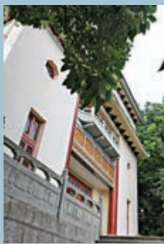
▲孔聖堂至今保留舊有外貌