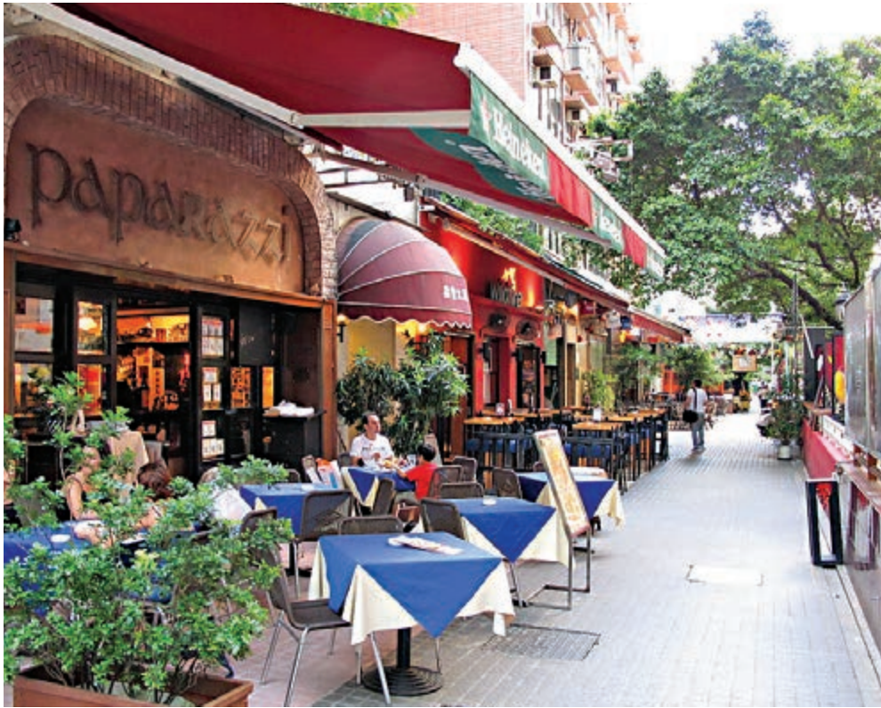
▲諾士佛臺如今富有異國風情