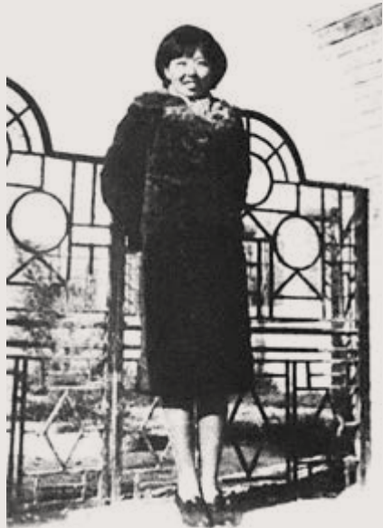
▲民國文壇女作家蕭紅