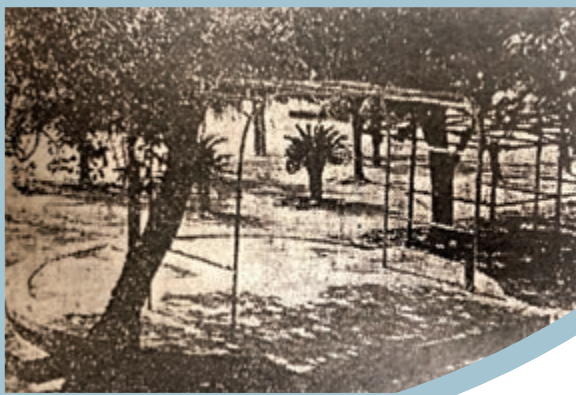
◀蕭紅墓上加建出租泳衣棚架（1957年）