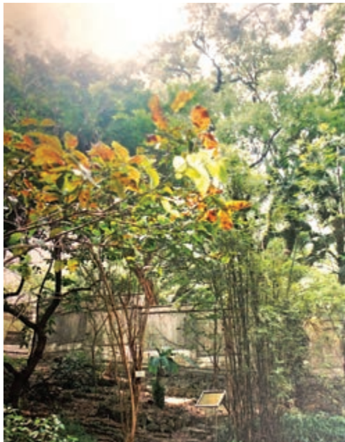
▲聖士提反女子中學後園立有蕭紅生平的簡介牌