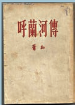
▲蕭紅重要作品《呼蘭河傳》在香港完成