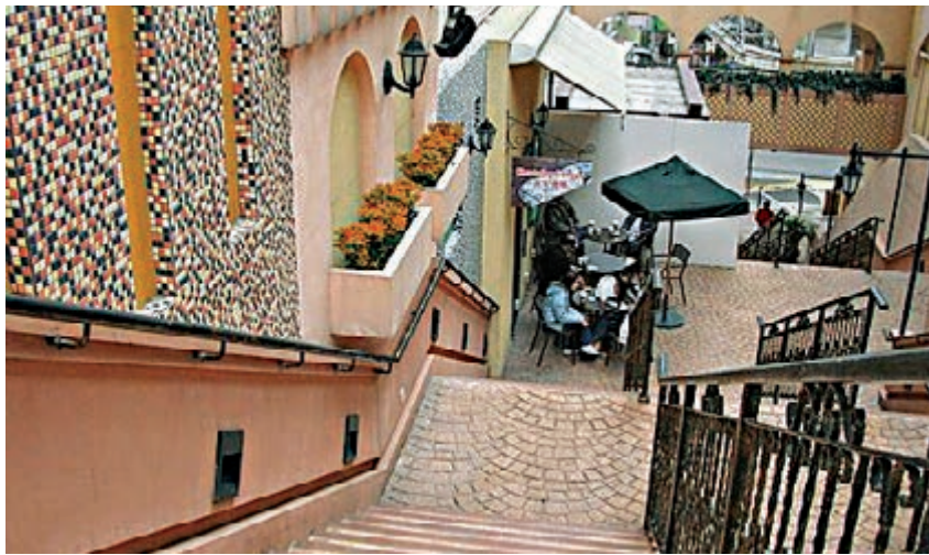
▶諾士佛階與諾士佛臺被併稱為諾士佛區