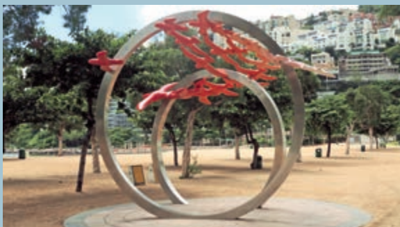
◀位於淺水灣海灘的蕭紅地標「飛鳥三十一」

「飛鳥三十一」地址：淺水灣泳灘 途經巴士線（新巴／城巴）： 6、6A、6X、63、65、66、73、260、973， 在淺水灣海灘或淺水灣道站下車