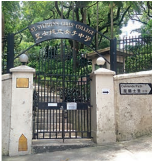
▲聖士提反女子中學是蕭紅逝世之地