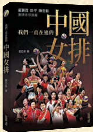
▲劉亞茹著《我們一直在追的中國女排》，香港中和出版

翻開書頁，是女排隊員一張張精彩瞬間：2000年，主攻手孫玥在世界女排大獎賽中大力扣球、2006年在世界女排大獎賽上配合打背飛的馮坤和劉亞男、2008年北京奧運會女排小組賽上精彩發球的馮坤、2012年世界女排大獎賽總決賽上奮力扣球的徐雲麗，以及坐在2016年里約奧運會