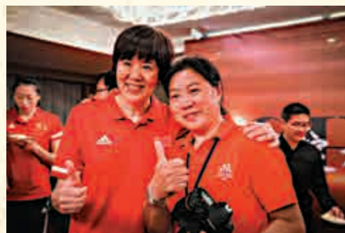
▲劉亞茹與郎平（左）合影