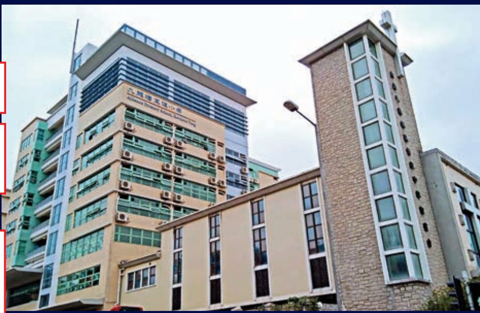
▲ 九龍塘名校宣道小學的管理層應該在今次事件中吸取教訓