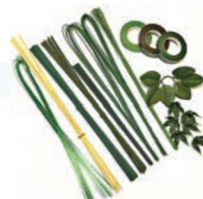
▲花藝鐵絲(左)與黏性膠帶

用於固定花材，可以將花材繞在鐵絲上定型，例如用於一些弱枝或變形花朵。為了不影響插花作品的外觀，可以選用專用的綠色鐵絲、褐色鐵絲等。