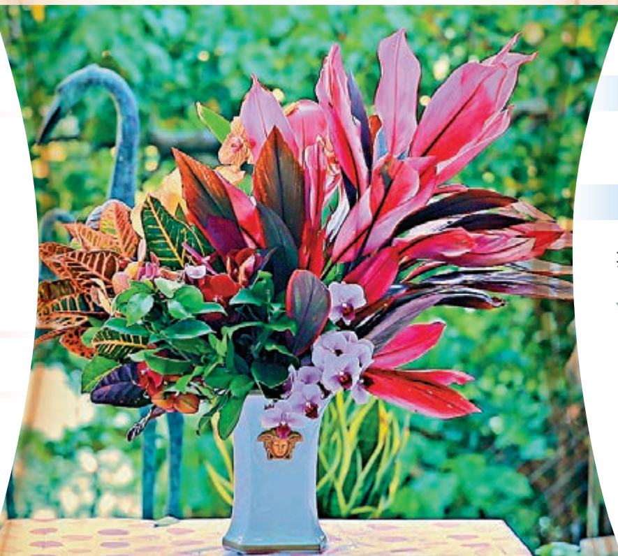
▲插花作品除了花，花器和葉也不可忽略