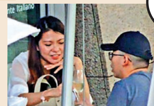
▲黃之鋒與女伴飲飽食醉後，足足在酒店內逗留了22小時