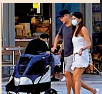
▲黃之鋒被揭一邊消費「手足」吸金，另一邊廂卻拖狗攬女到五星級酒店爆房