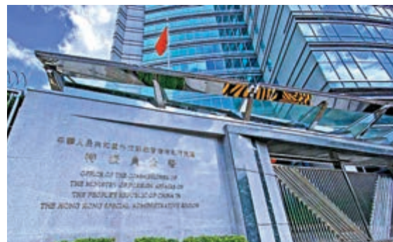
▲外交部駐港公署指出，中方的反制行動，當然包括美駐港總領館在內

【大公報訊】針對美駐港總領館顛倒是非、倒打一耙，惡意詆毀中方對包括美駐港總領館在內的美駐華使領館採取的正當、合理反制措施，