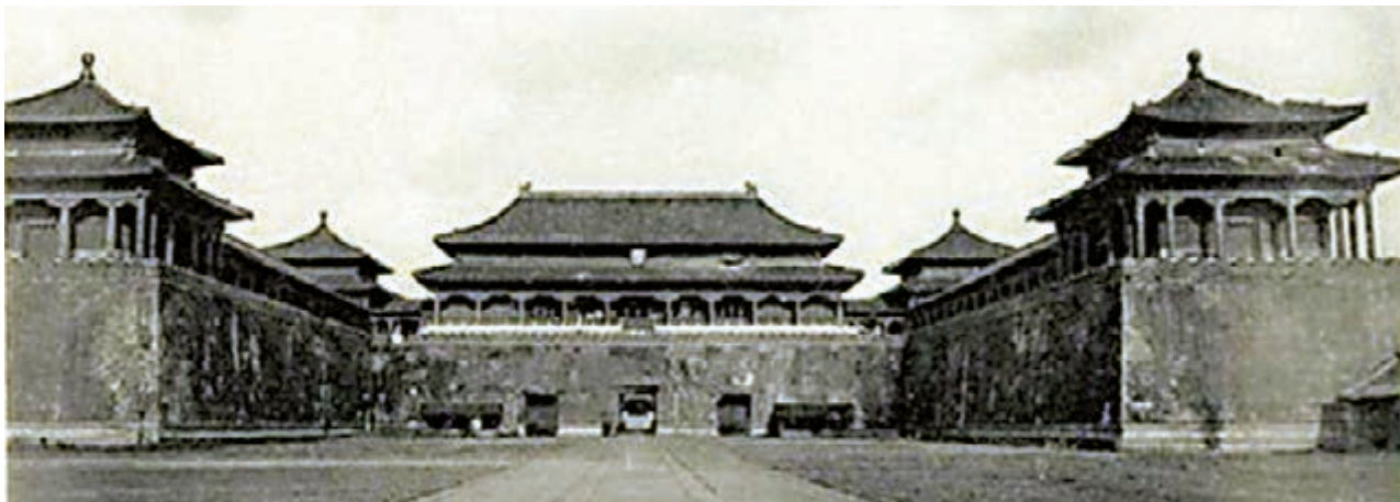
北京紫禁城 氣勢恢宏

按《明實錄》等權威記載，永樂二年（一四〇四年），明成祖朱棣升「北平」為「北京」。在古代中國語境裏，「京」就是京城即國都。當時南京已經是都城，再設北京，表示實行「兩京制」，北京宮殿、衙署也不或缺。決定遷都，營建北京宮殿、朝廷各衙門所用衙署，絕不是一時興之所至。明清歷史事實證明，永樂帝遷都北京，有力地捍衛了我們多民族國家的統一，促進了經濟社會大發展。如今紀念它，就要總結歷史經驗，推動實現中華民族偉大復興中國夢。