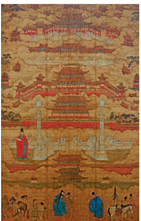
▲明嘉靖時期朱邦所繪的《明代北京宮殿圖》大英博物館藏

北京地區位於華北平原北沿，是以漢族為主體的中原農耕文化，與北部歷史上不同少數民族遊牧文化分界處。隨着北方遊牧民族逐漸崛起及對中原劫掠愈演愈烈，其戰略地位從秦漢一路上升。唐代安祿山由幽州（今北京）起兵發動「安史之亂」。到五代十