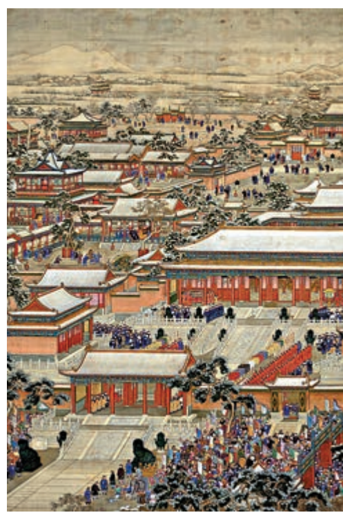
▲《萬國來朝圖》，反映清中期北京宮殿總體面貌

其後元世祖忽必烈決心建都大都城，考慮的就是此地「右（西）擁太行，左（東）注滄海」，在全中國版圖上東西兼顧陸疆、海疆兩方面；尤其是「撫中原，奠朔方」，因應北方少數民族崛起，中原農耕文化與北部邊疆遊牧文化，這兩種一面對峙的力量，在北京地區交會的現實。