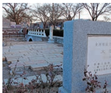
北京地安門東、元代通惠河故河道

吳越之地，自然條件得天獨厚，經過魏晉南北朝、宋元，中原士大夫多次「衣冠南渡」，把先進生產技術和文化帶到當地，很快發展成「魚米之鄉」，以南京為中心的江浙一帶，成為國家經濟文化中心。永樂帝遷都之後，北京地區成為國家政治、軍事中心，但不是經濟中心，需要東南即南方地區糧食和財賦的支撐。