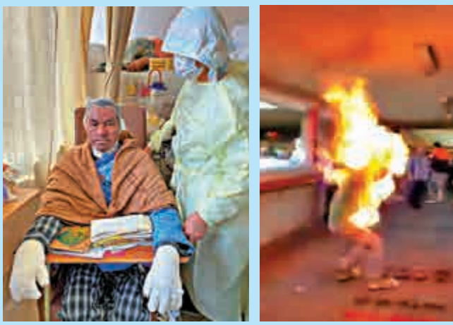
▲李先生在馬鞍山遭暴徒點火焚身，一度情況危殆