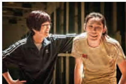
▲鞏俐（左）在片中飾演郎平，與排球名將朱婷演對手戲