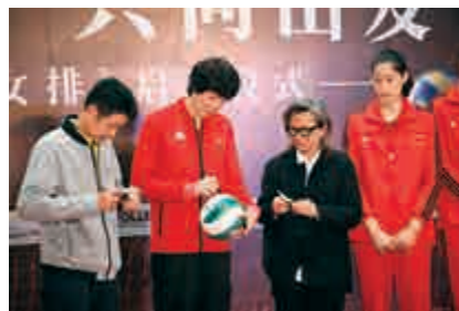
▲2019年《奪冠》舉行啟動儀式，郎平（左二）在排球上簽名，右二為陳可辛