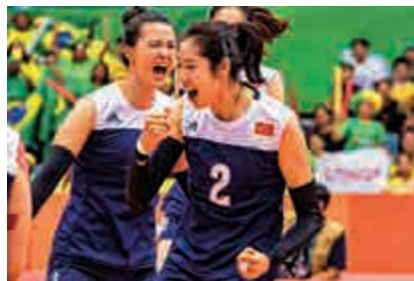
▲曾參與里約奧運中國女子排球隊隊員亮相電影，飾演自己