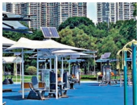
▲部分智能健身器械帶有自發電功能，市民可以邊鍛煉邊為公園發電

最近，在廣州二沙島散步的街坊們發現，二沙島體育公園拆去圍蔽，揭開神秘面紗。公園國慶假期已部分開放。目前二沙島體育公園原本設有多種傳統全民健身器械的公園西半側變化明顯。該區域新鋪了藍白色調的塑膠地板，搭建了一個有着七彩碎片頂棚的舞台，新設置的多款全民健身器械分布在舞台東西兩側。改造後的二沙島體育公園，帶有頂棚小舞台。公園的東半部，則保留着原有的人造草皮足球場，一條紅色塑膠緩跑徑在公園的綠化帶內蜿蜒。公園中蜿蜒的紅色塑膠緩跑徑、在晴波路下有一棵樹姿奇特的榕樹，形成「樹洞緩跑徑」之景觀。公園內的健身器械將比傳統的健身器械更有科技含量。據介紹，公園已按