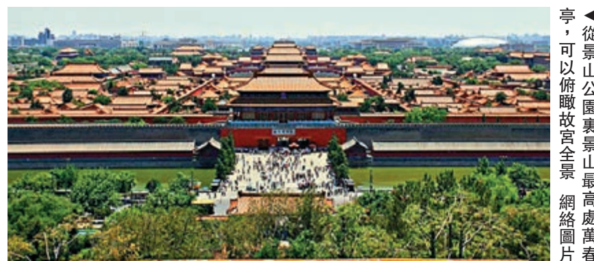
▲從景山公園裏景山最高處萬春亭，可以俯瞰故宮全景