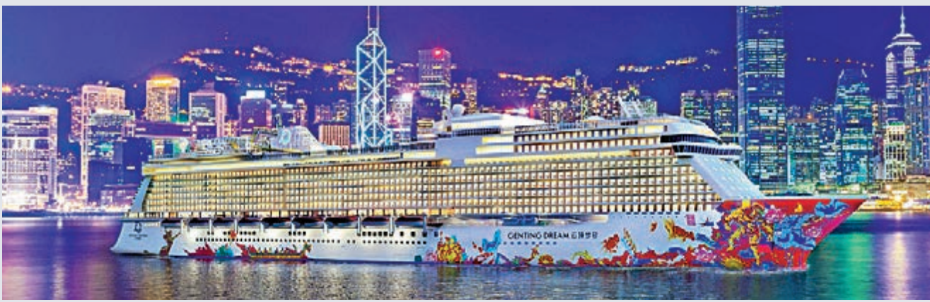
▲雲頂郵輪集團擬推出主打本地客的海上度假旅程（Seacation）

指引下復航，而目前已做足防疫工作，例如必須做健康申報、曾經出境乘客不可以上船、有測試陰性結果才可以登船；船上亦擬有社交距離限制，例如跟隨本港要求，餐廳四人一枱；自助餐有專人服務夾菜等。